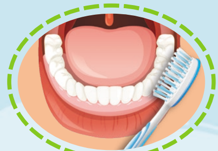
1 先刷全部牙齒的外側面