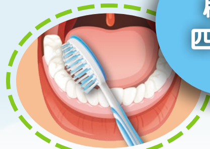
2 然後刷牙齒的內側