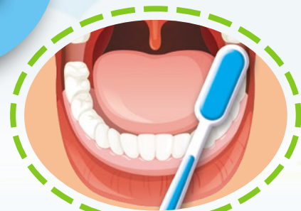
3 最後刷白齒的咀嚼面